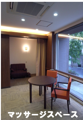
マッサージスペース