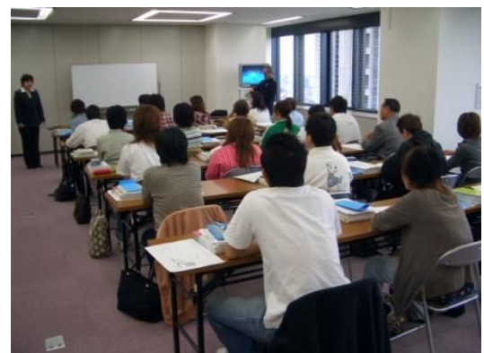
<介護教室「ほっと倶楽部」 受講風景>

介護現場で働くスタッフの資格取得から就業までをトータルにサポートすることによって、スタッフの学習・就業両面においてのモチベーションアップにつなげています。