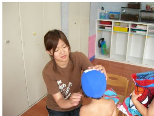
＜保育士派遣スタッフの様子＞